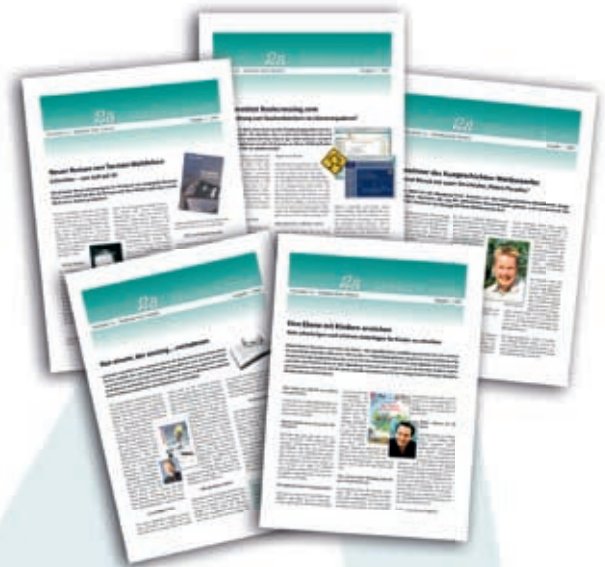
Newsletter „Akademie intern“

Zweimal im Jahr gibt die Akademie freier Autoren den Newsletter „Akademie intern“ heraus. Darin präsentieren wir die Neuerscheinungen und stellen die Arbeit des 2A-Verlags vor. Wir wollen aber auch Tipps zum Schreiben allgemein geben, interviewen bekannte