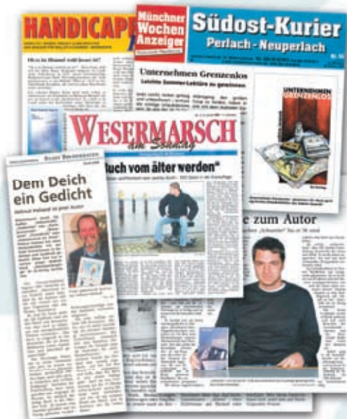
Auswahl aus dem Medienecho

P.S.: Wir haben zur Verallgemeinerung die männliche Form wie beispielsweise „der Autor“ gewählt. Natürlich sind von uns auch alle Autorinnen gemeint und angesprochen.